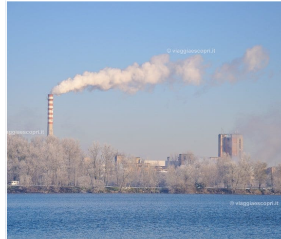
Lacs de Mantoue