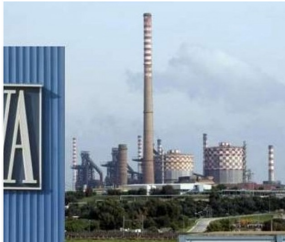
Ilva de Tarente